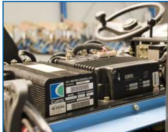
Hochwertige Duplex-, oder Triplex-Masten in verschiedenen Hubhöhen.

Die Wartung und Bedienung der Batterie erfolgt auf Grund der Bauform des Staplers unkompliziert und denkbar einfach. Die Batterie wird auf einem Schlitten komplett aus dem Chassis gezogen und ist so frei zugänglich. Je nach Ausführung werden die