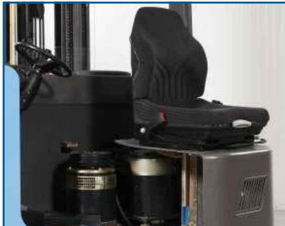
Komfortfahrersitze sind bei den Gabelstaplern von HanseLifter Serienausstattung.

Für Arbeiten an der Hydraulik und am Antrieb kann der Fahrerplatz komplett zur Seite geschoben werden und schafft Bewegungsspielraum zum Arbeiten.